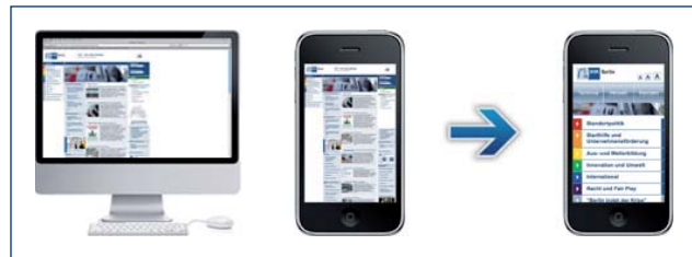
Mobilisierung von Internetseiten

Speziell den Kundenwünschen und Produkten angepasste iPhone-Applikationen, so genannte „Apps“, bieten zusätzlich ganz außergewöhnliche Anwendungsmöglichkeiten – insbesondere bei der Erschließung neuer Empfänger für den großen Zukunftsmarkt mobile internet advertising – mobile Werbung.